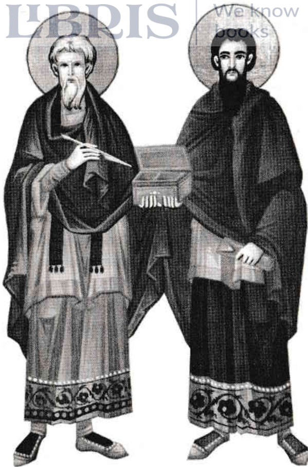
Sfinții Chir și Ioan